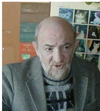
Ефим Адольфович Друц (Dzimis 1937. gadā), -. Dzejnieks, rakstnieks, etnogrāfs, loceklis Krievijas Ģeogrāfijas biedrības katedras Etnogrāfija no Zinātņu akadēmijas Krievijas, loceklis padomes mazākumtautību Krievijas Starptautiskā Kultūras fonda loceklis savienības Rakstnieku Krievijas, loceklis Maskavas Rakstnieku savienības loceklis Krievijas Rakstnieku savienības. Eksperts Gypsy dzīvesveids, kultūras un folkloras.