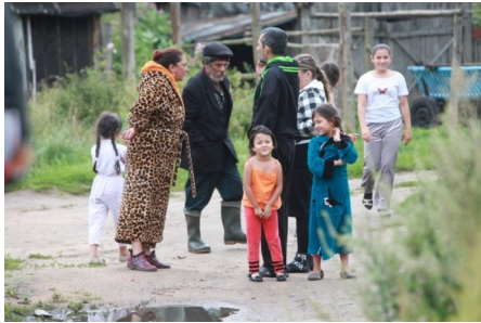
Latvijas Romi (čigāni)

Rumānija ir pazīstams ar nosaukumu radniecisks ar grieķu termina τσιγγάνοι (tsinganoi), Baltkrievija-цыгане , Polija-cyganie , Vacija-Zigeuner , Spanija-gitanos , Turcija – Çingene , Gruzija -bošebi , Japana-Roma , Kina -Luō mǔ rén , Afrikas cigani (dazadas valstis) - Alzīrija Xoraxa (or, Xorax) , Moroka -Xoraxane .